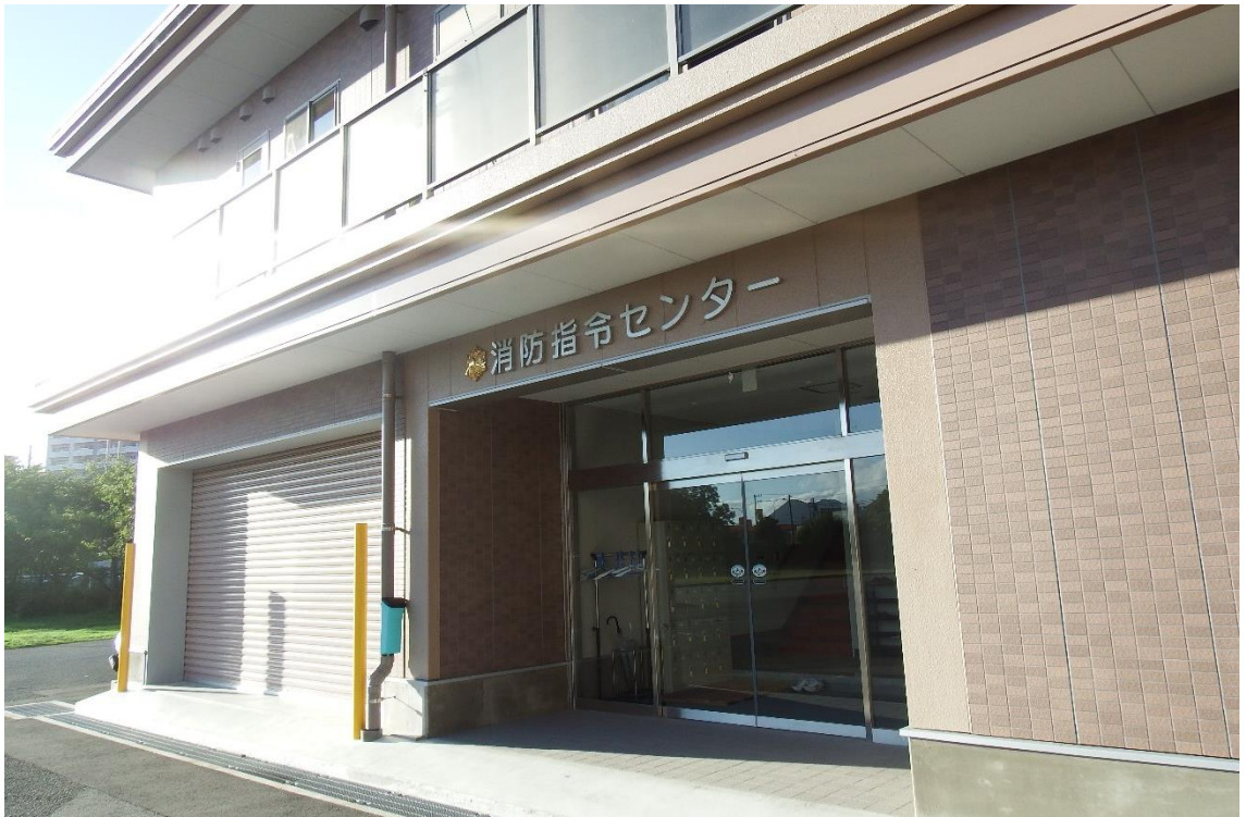
(消防指令センター)