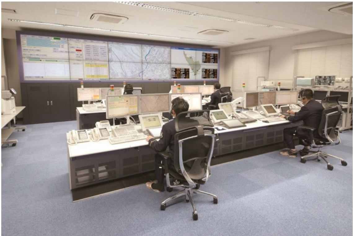
(消防指令センター)