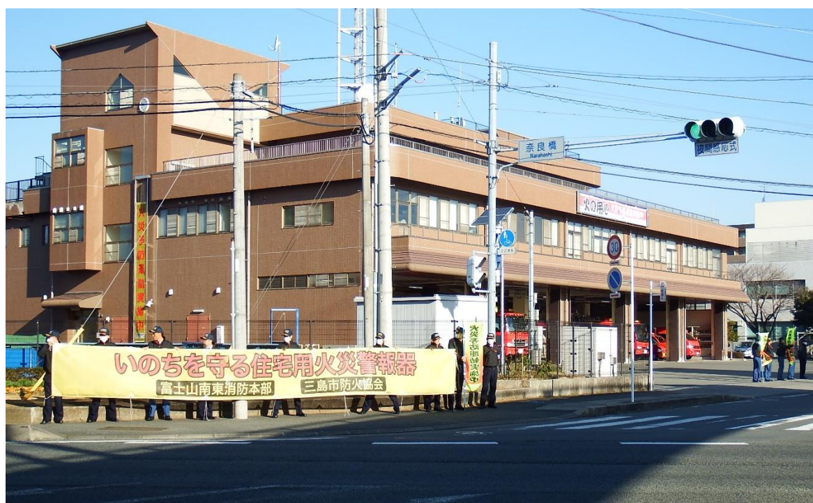
(平成 29 年度実施 火災予防運動広報活動)