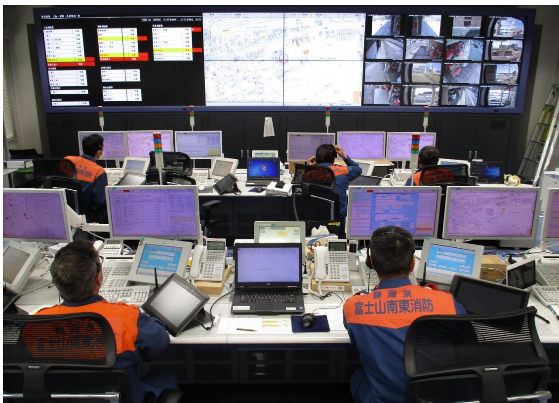
(消防指令センター)