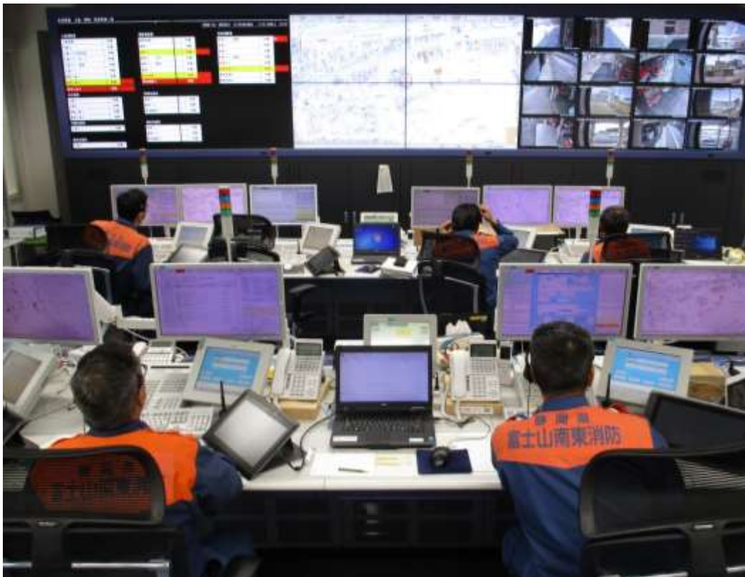
(消防指令センター)