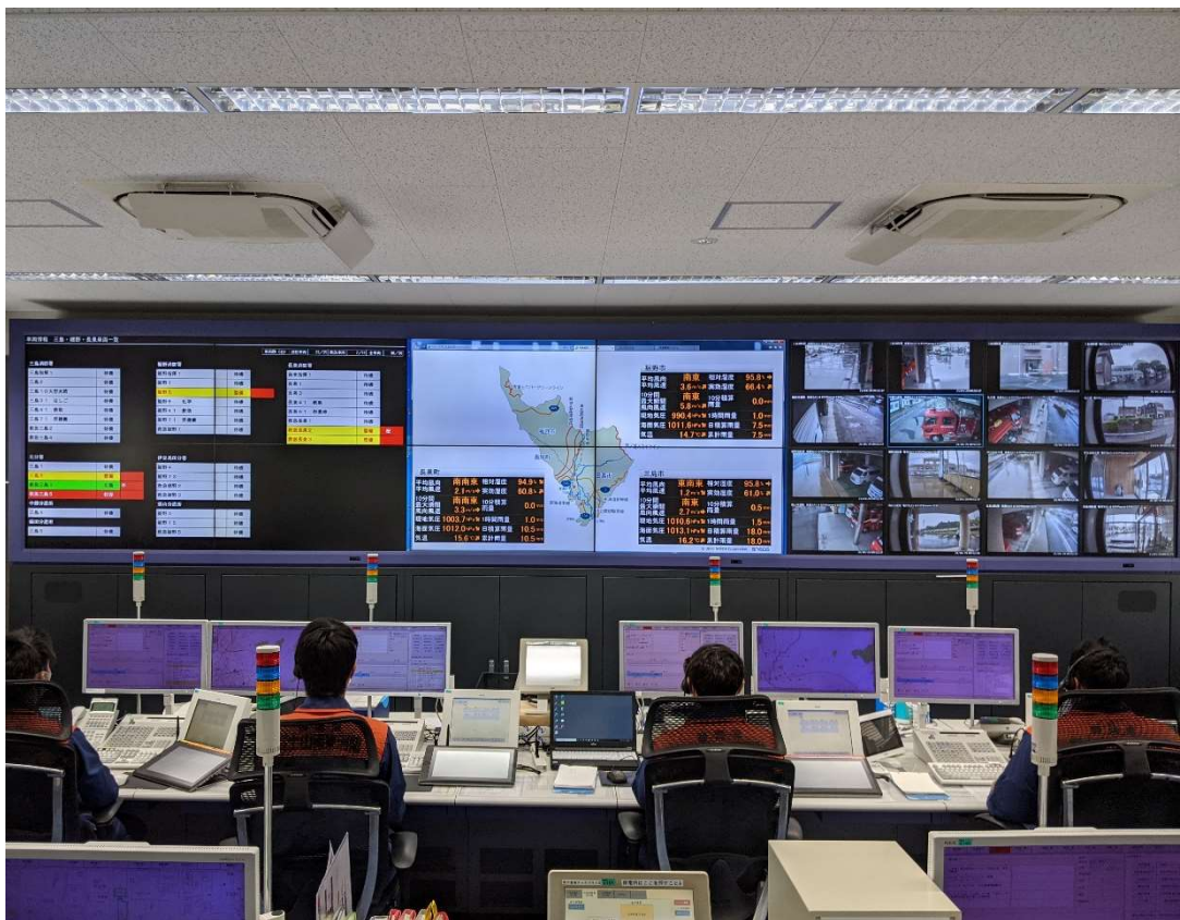
(消防指令センター)