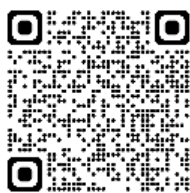
【テストセンター会場】