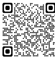
【本人確認に必要な書類】